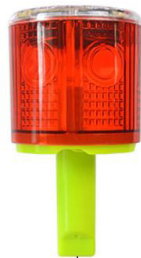
Balisage des zones dangereuses