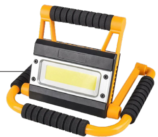
Spot de chantier