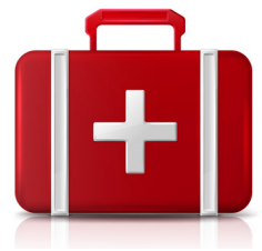
Kit 1er secours